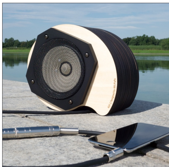
屋外でのレジャーで